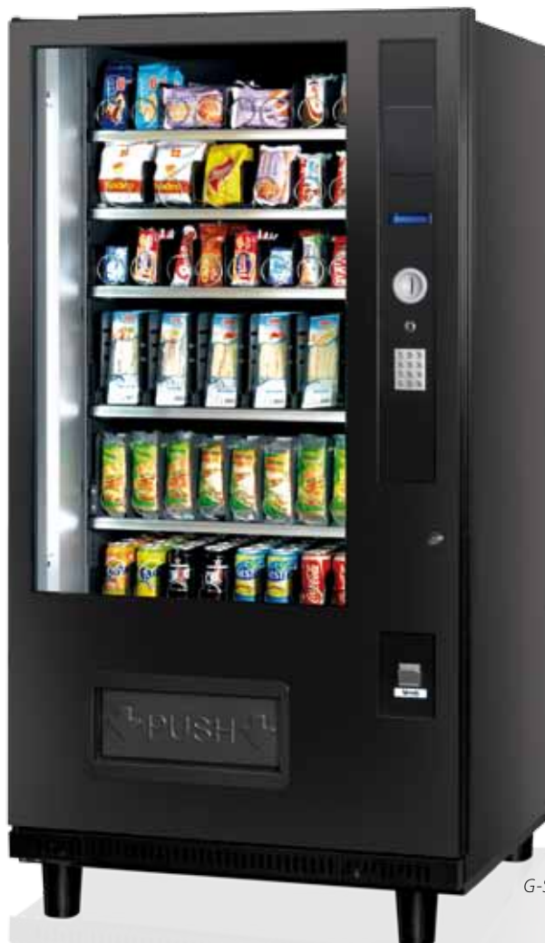
G-Snack Plus 8 Master